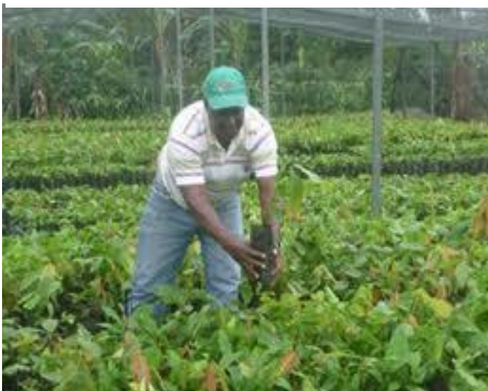
Plantones de cacao en vivero rústico y vivero tecnificado listos para ser injertados con