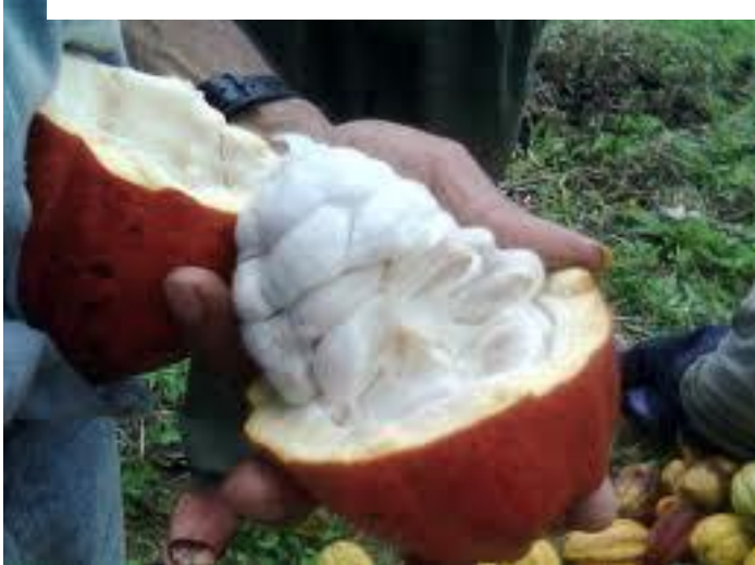
Estado maduro ideal para la cosecha de frutos de cacao

La cosecha se efectúa cuando el fruto alcanza la madurez completa, es decir cuando presenta un color verde amarillento o rojizo a un amarillo o anaranjado intenso. Los frutos bajos en forma manual y los altos con el uso de horquillas filudas. Esta labor se realiza cada 10 a 15 días, colectando los frutos maduros, sin sobremaduración, o la colecta de frutos verdes.