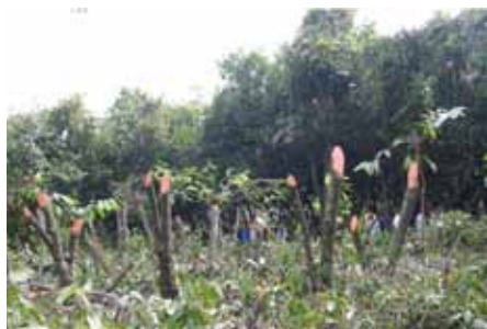
Recepa (1,5 m)

Consiste en cortar íntegramente todos los arboles de edad avanzada, aproximadamente a 40 o 60 cm de altura sobre el suelo, también pueden darse casos en los que se deba recepar a alturas de 1 a 2 metros.