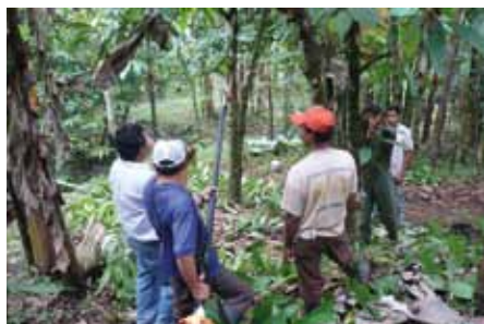
Raleo de ramas bajas