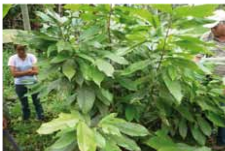
Antes de la Poda