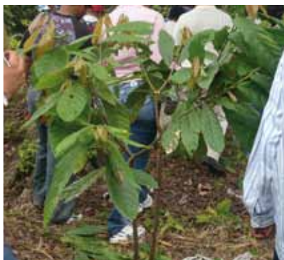
Poda de una planta de cacao por semilla