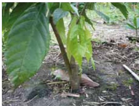
Planta antes de la poda de "chupón"