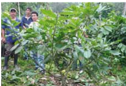
Después de la Poda