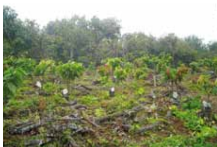
Recepa (60 cm)

La recepa puede hacerse en foma gradual para no afectar toda la parcela: