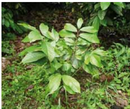
Poda de una planta de cacao por injerto