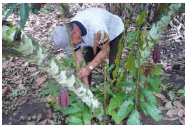
Selección de Chupón

De ser posible se deja crecer el chupón que nace al nivel del suelo, éste emitirá un molinillo y raíz pivotante; una vez desarrollado puede reemplazar a la planta madre.