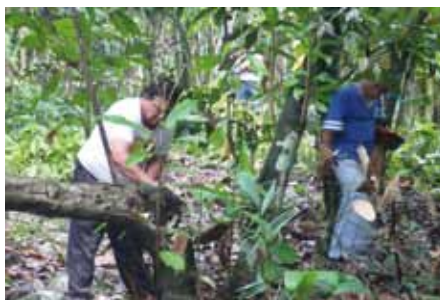
Eliminación de arboles improductivos