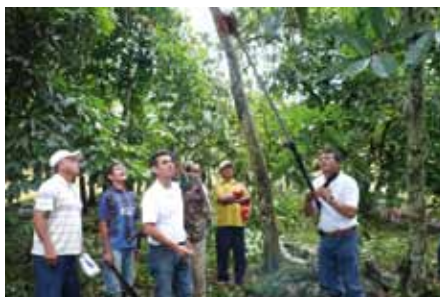
Eliminación de ramas bajas