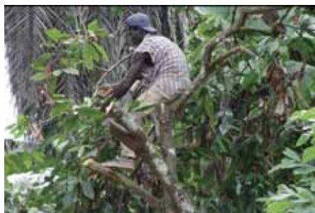
Eliminación de copa

Se indúcela salida de chupones mediante la poda fuerte de ramas bajas secundarias, desde la base hasta un tercio de altura total de la planta.