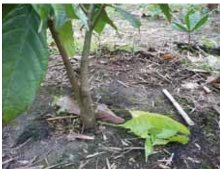
Planta después de la poda del "chupón"

Con ésta poda se eliminan los chupones, se entresacan las ramas mal formadas, improductivas o secas al interior de la copa y las ramillas conocidas como "plumillas"